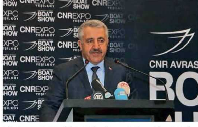
Ulaştırma, Denizcilik ve Haberleşme Bakanı Ahmet Arslan

tekte de yapacaklarını ifade ederek, "Dünya ticaretinden pay almanın denizcilikten geçtiğini biliyoruz. 14 yıldan beri hükümetimiz bu konuda ciddi adımlar attı; devletin, hükümetin imkanlarını ciddi anlamda seferber etti" diye konuştu.